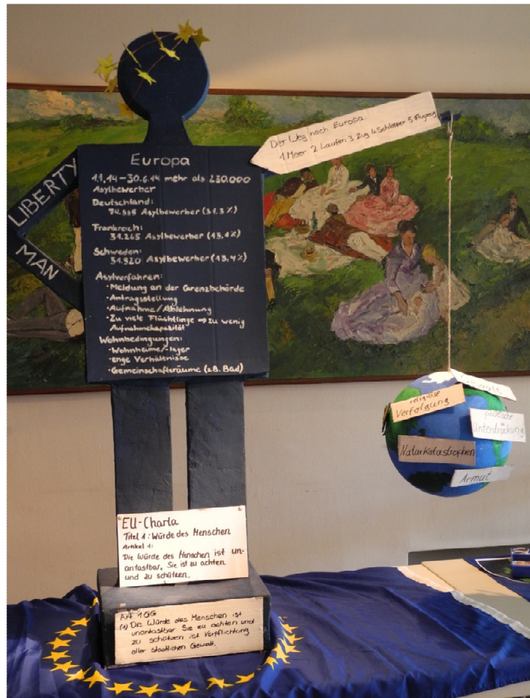
Alles in allem eine interessante Vortragsveranstaltung und eine gelungene Präsentation der Adolf-Reichwein-SchülerInnen.